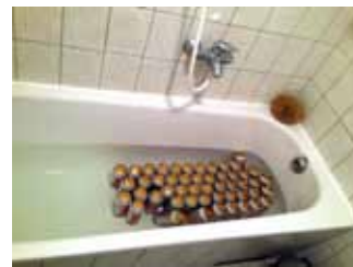
Badewanne voll Tyskie, Partytour-Konzert