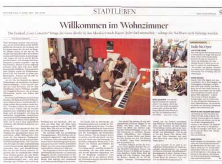
„Tagesspiegel“, 11. April 2013