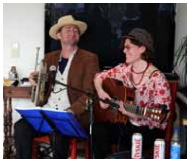
Das Jazz-Duo step to blue