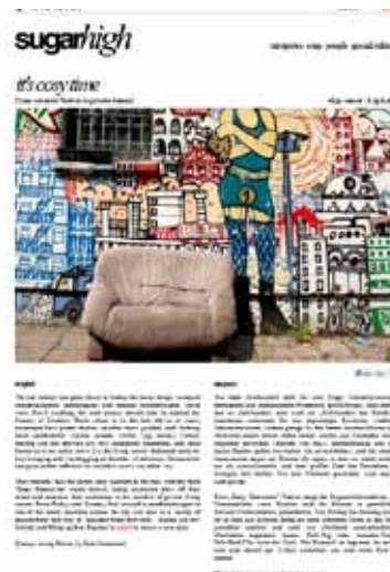
„Sugarhigh“, 8. April 2013