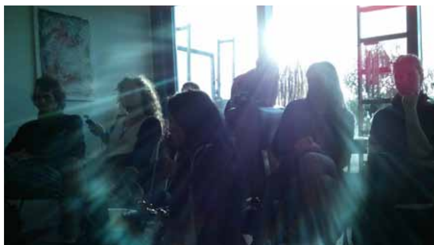
Das Publikum bei step to blue