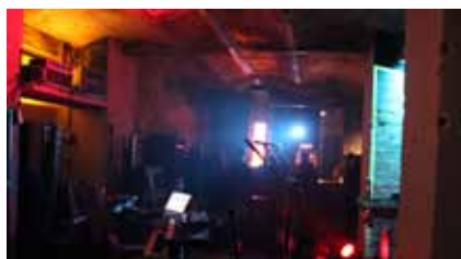
Vor dem Konzert von The Mouse Folk