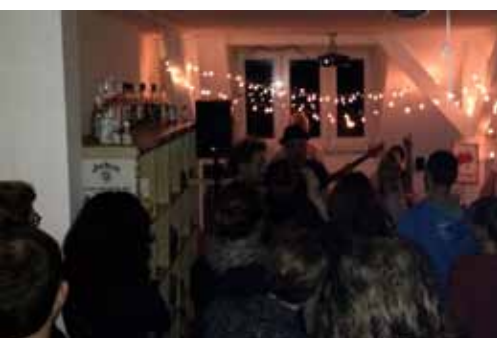
Beim Konzert mit Partytour