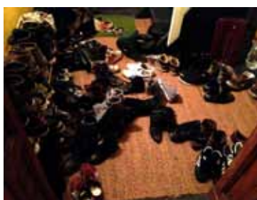
Schuhe vor der Haustür, Partytour-Konzert