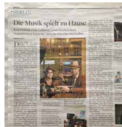
„DIE WELT Kompakt“, 12. April 2013