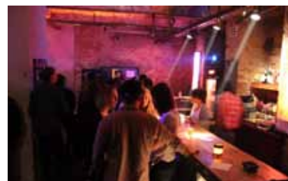
An der Bar in der Möbelfabrik