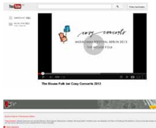
Cosy Concerts auf YouTube