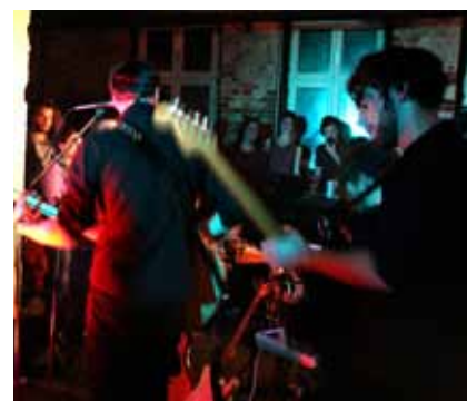
The Mouse Folk beim Abschlusskonzert in der Möbelfabrik