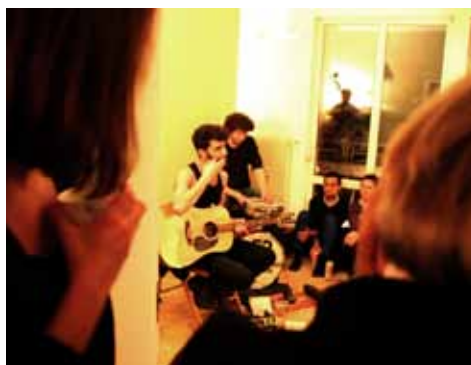
Blick ins Wohnzimmer zu Two Wooden Stones