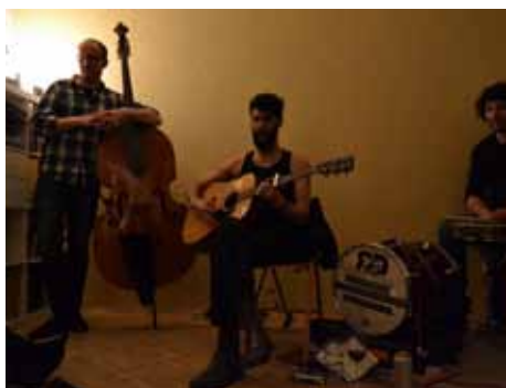
Two Wooden Stones